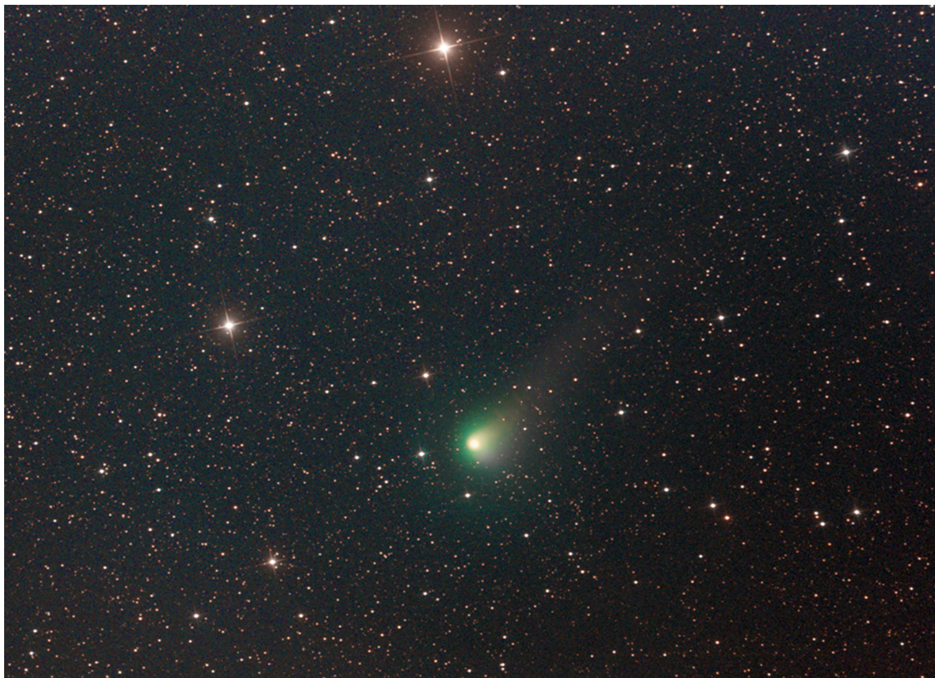
Komet C/2017 T2

Dieser bereits im Herbst 2017 entdeckte Komet passiert Anfang Mai 2020 sein Perihel und kann von Spezialisten in den nächsten Wochen sogar im Fernglas aufgefunden werden (Details finden sich in der Datei Info_AVKa_8.pdf).